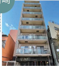
▶ 川崎 (ラ・プリーズ)