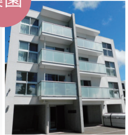
▶ 札幌桑園 (ブランドール桑園)