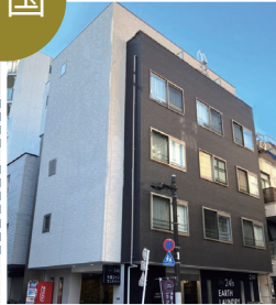
▶ 東京両国 (プライムシティ両国)